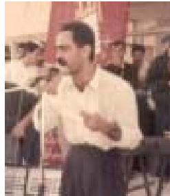
نازاد حه‌مه‌ که‌ریم

نه‌نجام بگه‌یه‌نری هیشتا جیگای گومانه‌. ده‌یان و سه‌دان که‌سی مه‌ده‌نی و بی‌تاوان سه‌ره‌رای نه‌وه‌ی که‌ قسه‌که‌رانی ره‌سی نه‌بنه‌ قوربانی کاره‌ خۆکوژی و نۆتۆمبیله‌ نه‌میریکی و حکومه‌تی کاتی عیراق مین‌ریژ کراوه‌کان. نه‌مه‌له‌که‌تیک دا که‌ به‌رده‌وام رایده‌گه‌یه‌نن که‌ هه‌لبژاردن دوا ته‌نها نه‌بهر نه‌وه‌ی کوردیت دوا کۆشتن ناخری. نه‌ وولاتیک دا که‌ {ناری جی} ته‌رمه‌که‌شت ده‌سووتینن، نه‌بهر نه‌وه‌ی به‌شان و {بی‌که‌ی سی} به‌ ده‌ست سه‌ر سه‌ربه‌ مه‌زه‌ب و دینیکی تری و بروات جاده‌کانیان گرتووه‌ و ده‌ستریژی گۆله‌ به‌ خورافه‌یه‌کی تر هه‌یه‌ جه‌سته‌ت سه‌ردنی پیرو جوان ده‌سی. نه‌ وولاتیک نه‌نجن نه‌نجن ده‌که‌ن، نه‌بهر نه‌وه‌ی ژنیت دا که‌ فرۆکه‌کانی نه‌میرکا بالاخانه‌ی چه‌ند نه‌ومی به‌سه‌ر خه‌لک ی بی‌تاواندا ده‌روخینن. نه‌ وولاتیک دا که‌ به‌بهر چاوی کامیراوه‌ ئینسان سه‌رده‌برن، دلیل گۆله‌ باران ده‌که‌ن. نه‌ جیگایه‌ک دا که‌ روژنی یه‌