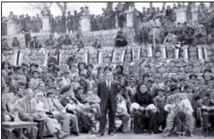
هه‌له‌بجه ۱۹۵۵، بو یه‌که‌م جار ئەم وینه‌یه بلاوده‌کرپه‌ته‌وه

له میژووی ئەده‌بی کوردیدا هه‌له‌بجه ناویکی دیار و دره‌وشاوه‌یه له‌م مه‌یدانه‌دا و چه‌ندین