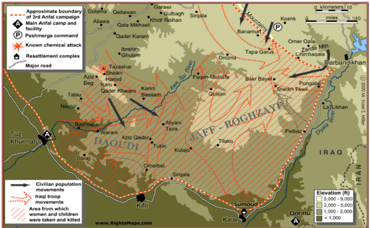
ANATOMY OF A CAMPAIGN Third Anfal (South): 7 April - 20 April 1988