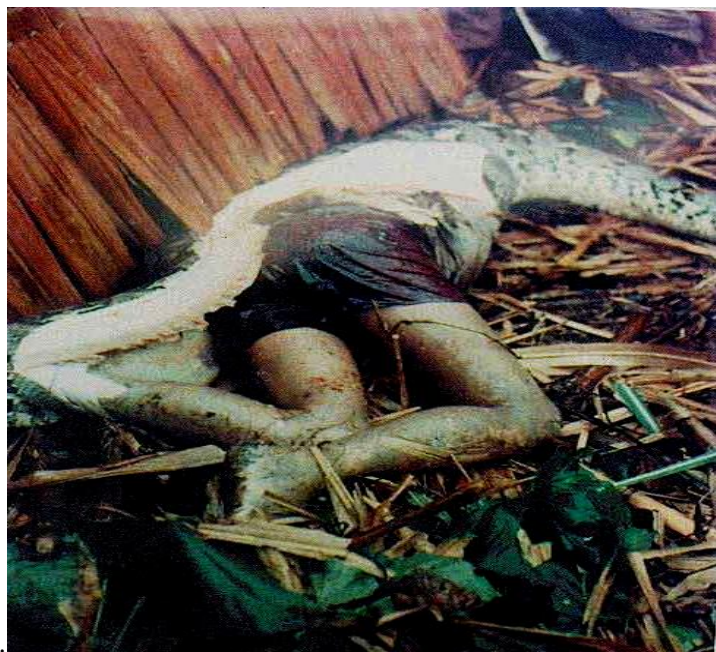
دهره یینانی لاشه ی زه لامه که له ناو سکی ماره که

ئه وه سه رگوزشته ی ماره که بوو ، تیمساحه که ش به هه مان شیوه زه لامیکی قووتدابوو پاشان گرتیان و لاشه ی زه لامه که یان له سکی دهره یینا له بهر ئه وه ی قه باره ی وینه کان گهورهن ناتوانم هه موو وینه کان دابنیم به لام هه ر به ریژیک ئاره زووی کرد ئه وا به چاوان با پیوه ندیم پیوه بکات هه موو وینه کانی به