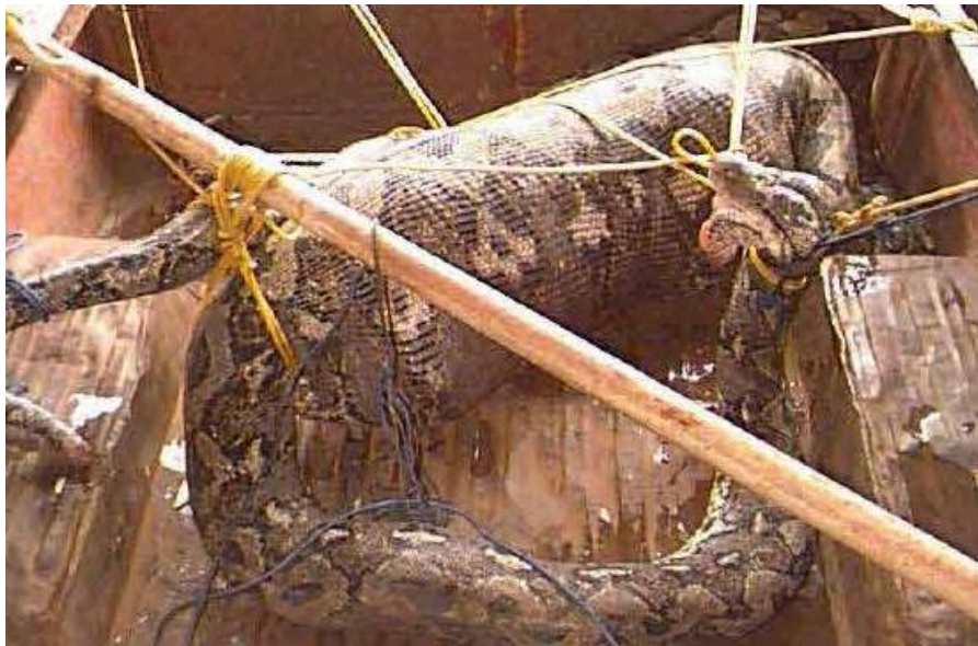
ماره که پیش ئه وه ی سکی بدرن و لاشه ی زه لامه که دهره یینن

شانه و ديه و ديفروشيت به خه لکی ولاته که .. به هر حال پاشان ماره که یان کوشت و لاشه ی زه لامه که یان له سکی دهره ینا .، ته ماشای ئهم وینانه ی خواره وه بکه :