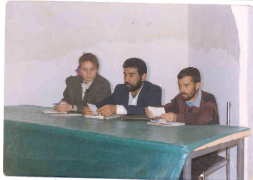
یه که م کۆبونه وه بۆ سازدانی یه که م فیسیتفالی ئه نفال نوسه ری بابه ت له فیسیتفالی یه که م