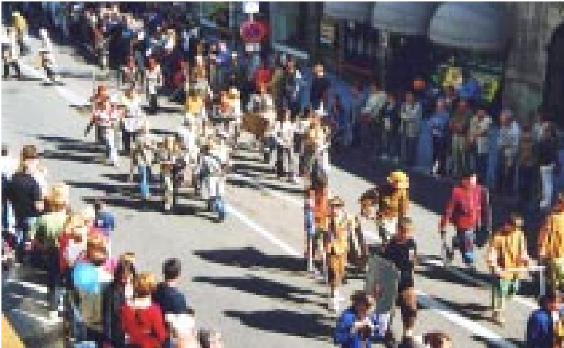
چهند مندالکی کورد له ریزهوهکدا دهبنرین

گهزجی و ههیه له پیناوی مانه وه وهرگرتنی ئیقامه دا، له گهل ئافره تیکدا به پرسی گریبهندی هاوسه ریتیان مۆرکردوو وه خیزانیان پیکه و مناوه، که له رووی تهمه نه وه، به دایک و کوپ دهشین