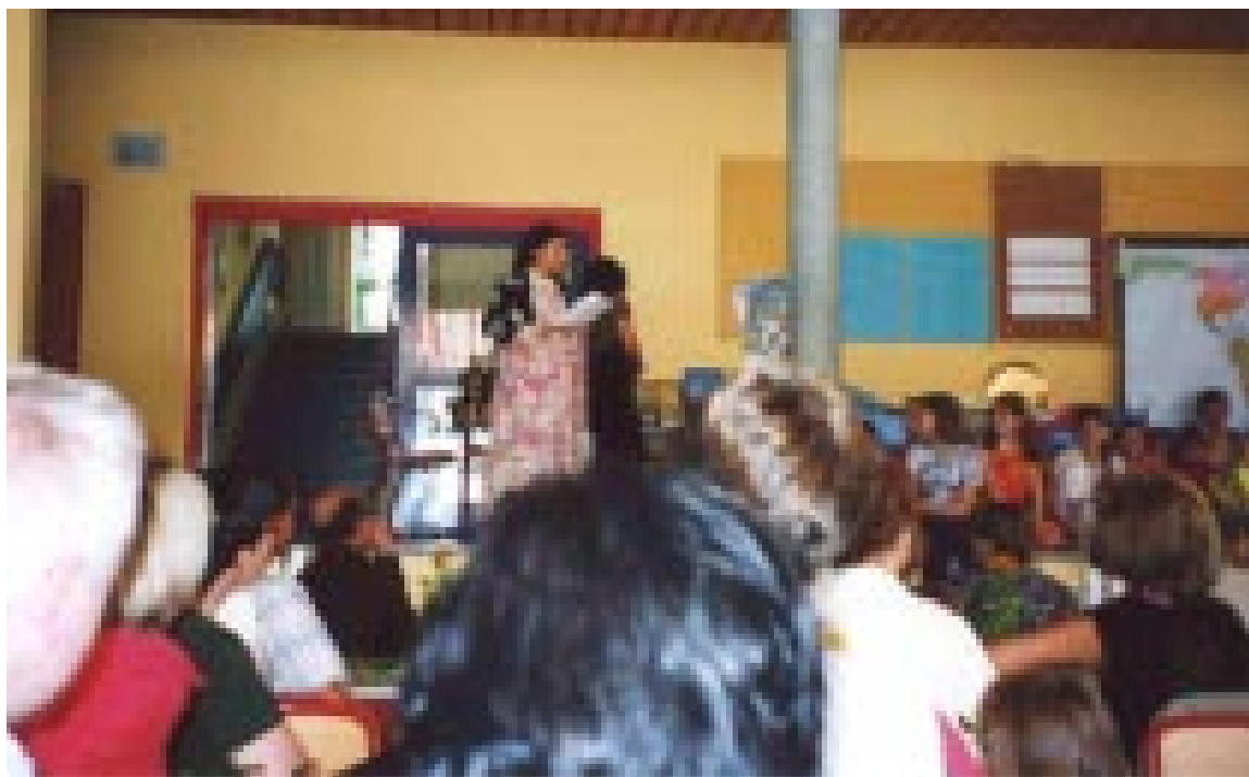
خویندکاریکی کورد له یه کترناسینی کولتوره کان له قوتابخانه دا به جل و بهرگی کوردیه وه باسی میژوو و کولتوری نه ته وه که ی خۆی ده کات

بو به شداریکردن له هه لپه ژاردنه کانی عیراقداو پته وکردنی پیگه ی کورد له ده سه لاتتی حوکمدا، له کۆی (۲۶۳۶۸۵) دهنگدهری دهره وه ی عیراق، له ۳۰٪ یان دهنگیان به لیستی هاوپه یمانی کوردستان داوه