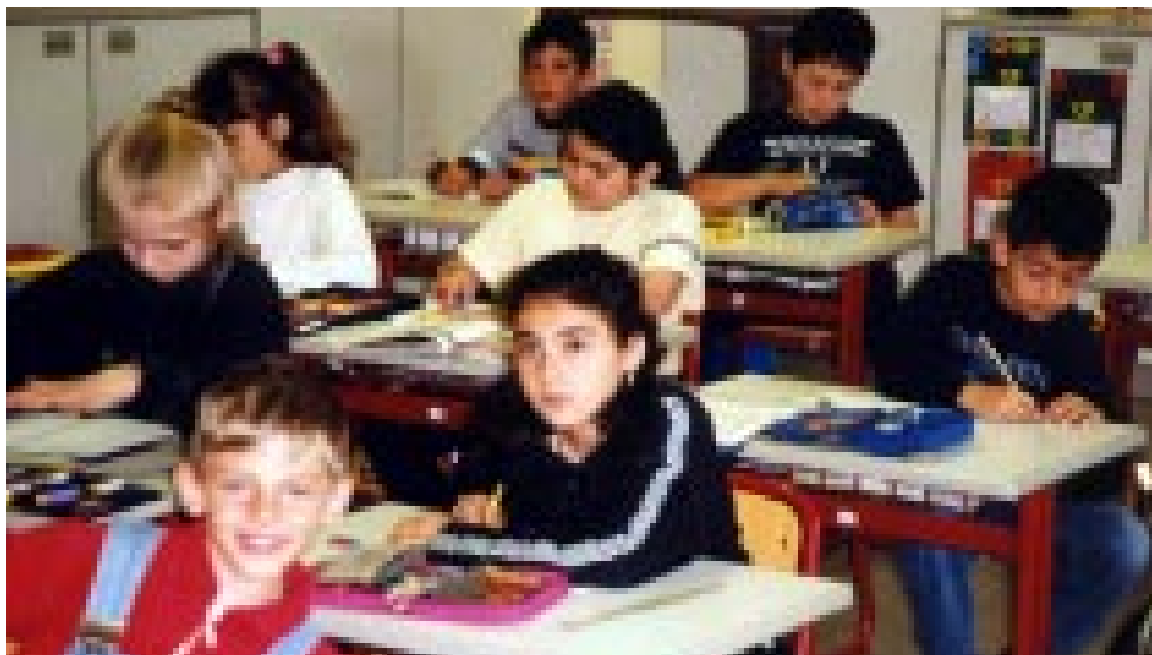
کچه کوردهک له پۆلی خویندندا

دهرهوه، ههر ئه و رێژه بهرچاوه نییه که پیتویست دهکات له سه هری بسه نگرێنه وه و دهسه لاتی ش چاره سه ربیه کی ریشه بیان بۆ بدۆزیتته وه؟! سه رباری ئه و هه موو ئاسته نگانه ش، نالیم خه لک ناگه ریتته وه، به لام ده بیت بزانی ئه و خه لکانه کین و رێژه که بیان ده گاته ئه و ئاسته ی که پیتی دلخۆش بین؟! به گویره ی خویندنه وه ی واقیع و زۆریه ی مه زهنده کان که له راستیه وه سه رچاوه بیان گرتوه، خه لکه گه راوه کان به م شیویه پۆلین ده کترین؛-