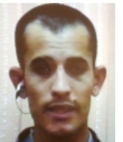
تیرۆریست بۆرەان تەلەعت

تیرۆریست مەریوان لە بەشێکی تری دانیشپانانەکانی تیشک دەخاتە سەر ورەدەکارەکانی چۆنیەتی عیلاقە دانان و چەندکاریکی نێبازی لە دەوگ و زاخۆ و دەلیت: شیخ گوتی خۆت نامادەبیکە لەوانەیە سەفەرێکی دەوگ بکەین و یەک دوو رۆژمان بێ ددچ، رۆژنێکیان چوینە دەوگ پیاسایەکمان کرد و نانمان خوارد، داویی چوینە زاخۆ چوینە ئوتیل مێشگان شەولەوئ مایینەو، شەو تۆزیک دەست گەمە سیکیسمان کرد بەس هەر نێحیتادی بوو، بۆ بەیانی لە رێگە پێشی گوت ئەگەر عیلاقە لەگەڵ کچیک بیستی یان کسورێک لە خۆت رادەبێت تەئسیرت ئی ناکات؟ گوتم نەخێر نێحیتادییە، ئیتر پێم گوت ئەگەر ئەتو هەرچیم پێ بلێتی بە گوتیت دەگم، بەیانی چوینە مەنتیقەیک کە لە پشت ئیبراهیم خەلیلە ناوی شینارە چوینە نەوێنەدەر مافوروشتمان برد کە دانیشتین نانمان خوارد، محاولەلە دەکرد عیلاقە داوینم لەگەڵ کچ، پێمی گوت بەس ئاگاداریە (لاتتەق فی حب عسیمی) نەگەویە داوی خۆتەوپیستی ئەگەر یەکیک ئیشت لە سەرکرد خۆشت ئەوئ ناکات لێی بی، بەس کۆنترۆلی بەکی بۆ بەرژەندی و کاری خۆت لە موستەقبەل ئیشت پێی دەبێت، نێحیتیمالە هەندیک ئیش هەیە