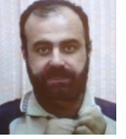
تیرۆریست شیخ زانا