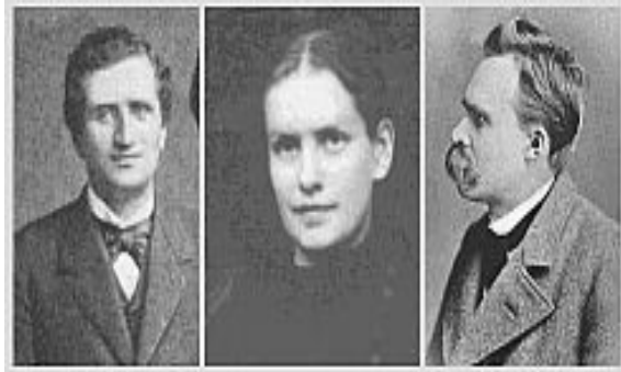
یه که مین دیدار

ناناسا بدن , له یه کتر جیا بوونه وه . نه وکاته که لیک جیا بوونه وه , میجنه تیکی گه وره بوو , وای لیها ت نیچه به بی نه فیون خه وی لی نه ده که وت . نیچه ده نیت نه م شهو نه وهنده تلیاک ده خوم تاده مر م , له دوای شکستی نه وینیکی گه وره , قهیرانه که ی نیچه توندتر و سه ختتر بووه , سی جار هه ولی خو کوشتنی دا به لام نه هیچیاندا سه رکه وتوو نه بوو , سه فه ریک بریک ی زوری له شله ی کلورای ی خواره وه که چی نه مرد .