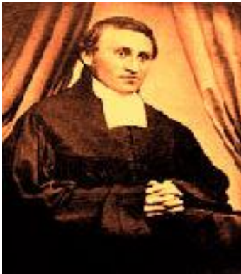
Carl Ludwig Nietzsche

فریدریک ویلهایم نیچە نه 15 ی ئۆکتۆبری سالی 1844 دا له شاری (رۆکن) (Rocken) یلایه تی ساکسونی (Saxony) رۆژه لاتی ئەلمانیا که نه و کاته پاریزگایه کی سهر به شایه کی دهسه لاتداری برۆس بوو . نه خیزانیکی پرۆتستانتی دین دار هاتۆته دنیاوه .