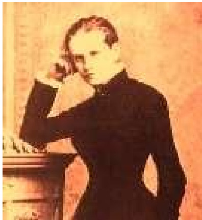
Louu Von Salome

له دایک نابیت . سه ره تا هه رسیکیان برپاریاندا بوو که له چوار چپوه ی هاورپییه تیه کی نه فلاتونیدا ، خه ریکی لیکوئینه وه فه لسه فیه کانی خویان بن ، به لام دواتر هه ریه ک له نیچه و ره ی خوشه ویستی خویان بۆ (لۆ) ناشکرا کرد ، داویان له (لۆ) کرد شویان پیبکات .