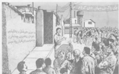
په‌رۆژ بێتا په‌کی نه‌یار رۆژی چیهانی کریکار

Det stölviga upproret på 25 år reser just nu i de kurdiska delarna av Kurdistan, i förra veckan dömdes närat 20 ministrar i demonstration, den iranska regjeringen har skickat 100 000 soldater för att lösa protesterna och fullt underrättelsebataljoner råder. Men hittills har omvärlden blundat för händelserna.