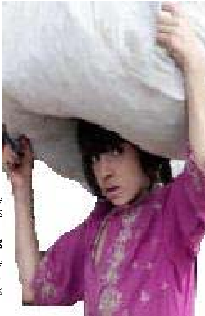
به‌رده‌وام بن، بنیادی ژیره‌وژور

باسی ئه‌مه‌رو له‌ نیوان پسپۆرانی ئابوری کومپانیا گه‌وره‌ ئیونه‌ته‌وه‌یه‌یه‌کان، ئه‌وه‌یه‌ که کاری مندالان خه‌ریکه‌ ده‌بێ به‌ دیاره‌دیه‌کی ده‌ست و پێگر. ئیتر ناکرێ به‌ شه‌پلاخه‌ لیدان ئه‌م دم و چاوه‌ سه‌هه‌ر رابگیریت، شین بوته‌وه‌ و به‌ده‌ره‌وه‌یه‌. مه‌سه‌ره‌ی ئابوری و زه‌بریکی ئابوریی که ئه‌م کۆمه‌لگایه‌ به‌ ئاشکرا بونی بابه‌تی شاراوه‌ی کاری مندالان لێی که‌وتوه، زۆر قورس و گرانه. هاوکات له‌گه‌ل چه‌ره‌که‌ته‌ ناره‌زایه‌تی‌ه‌کان و چالاکییه‌ کولتوریه‌کانی بزوتنه‌وه‌ی هه‌لوه‌شانه‌وه‌ی کاری مندالان، خاوه‌نانی سه‌رما‌یه‌ و ئورگانه‌ گه‌وره‌ و بچوکه‌کانیشیان کۆبونه‌وه‌ و وتووێژ و راویژی زۆریان ئه‌نزام داوه. بانکی جیهانی، کومپانییا جیهانییه‌کان و هتد، ده‌بانه‌وه‌ی له‌ قازاجی کاریک که‌ ده‌ست چکۆله‌کان و پێ چکۆله‌کان بو‌ سه‌رما‌یه‌دارانی گه‌وره‌ و بچوک به‌ده‌ستی دینچاوه‌ بقونجین؛ به‌لام نائوان به‌م شیوه‌یه‌ش به‌ بیده‌نگی درێژه‌ به‌ به‌هه‌ره کیشی و چه‌وسانه‌وه‌ بده‌ن سه‌ره‌رای سه‌ره‌که‌وتنی کاتی سه‌رما‌یه‌داری له‌ نه‌گۆر نیشاندانی وه‌زی ئیستا و