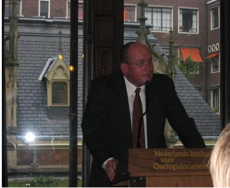
ف-تېفنس له کاتې قسه کردن له سره کتیبه که ی نارنۆلد

پرسیار: قان ئانزات داواکرد سهدام و عهلی کیمیایی شایه دیبدن له کاتې پیداجوونه وهی دۆزه که یدا له لاهای له رۆژی 23-10-2006 دا، چۆن ئەمه ده بینیت؟ ئایه ئەمه دوه ریکی ده بییت؟