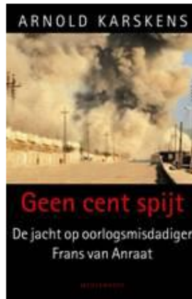
به رگی کتیبی (هیچ په شیمان نیم)

نارنۆلد: من لام وانیه له م کیشه یه دا گوچ له شایه دی سهدام و عهلی کیمیایی بگیرییت، ئەمه شتیکی واقعی و دروست نیه، شتیکی تریش هه یه که دۆکومینت و ته له کس هه ن که تیا یدا ریره وی په یوه ندیه کان دیاره له نیوان فرانس و کیدابوو، وه چی بردراوه، دهوری فرانس بردنی ئەم مادانه بووه به قاچاغ، شه رت نیه سهدام راسته وخۆ په یوه ندی به مه وه بوو بییت یان ئاگادار بوو بییت.