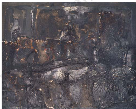
70x100 cm mixed media بینا و نیشان

ئه و "راسته" له تابلۆدا "شتایه تی شته". نادیاره کان به دیار ده خات. که واته به واتای هایدگه ر "وهرچه رخانه راستی له نیو کار {تابلۆ} دا له چالاکیدایه. هاوکاتیش "راستی له گه وهه ره که ییدا هه بوونه که ی به رده وامه، راستیش وهک خۆی هه بوونه که ی له نیو دینامیکی رۆشنایی و په نهانییه کی له راده به دهر دایه. راستی جهنگی جهنگه کانه، له ویدا له نیو هه موو رۆژگاره کاندایه ئاوه لایی به جۆریک له جۆره کان براوه یه، که هه لگری هه موو شتیکیشه و له دهر وه شپرا هه موو ئه و شتانه خۆیان ده کیشنه وه، هه ر تایه ته مندییه که له بوونایه تی ئه و راستییه خۆی به دیار ده خا و ده شاریته وه. هه ر کاتیک و چۆن ئه و جهنگه ده سته پییکا و وهرچه رخی، به مجۆره جهنگه وه ره کان له ریگه ی ئه و جهنگه وه ریده که ن – رۆشنایی و په نهانی – لیکدا بر او له گه ل یه کتردا. به م شیوه یه له و جهنگه دا ئاوه لایی سه رده که وچ. راستی ئه و ئاوه لاییه ئاوه لاییه یه. (6)