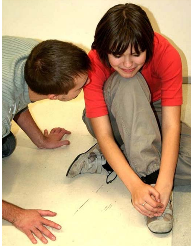
خوښه ويستی... كريدانى روڤي مروڤه كان

(نازه نين) هاورىم به سه ره اتى نه و كچ و كوره ي باسكرد، كه به رده وام نامه و ديداره كانيان پر بوون له وشه گه ل وه (نازيم كه م تو خوښه ويستين كه سى منى، تو دل و گيانمى، تو خوڻى و ناسو ده يى منى، ژيانى من به تو وه جوانه و بى تو ژيان هيج مانايه كى نيه، من هه رگيز ناتوانم بى تو بزييم، به رده وام كه ن ده كه م ليته وه نزيك بم و له نزيكه وه بيت. نازيم هه ست نه كه م بونى تو كه زى به رده وام بوونى ژيانم پى نه به خشى، بوونى من ته واپه يوه سته به تو ي نازين). (نازه نين) ده يگوت: نزيكه ي (3) سال نه م كچ و كوره له په يوه ندييه كى خوښه ويستی توندوتوڻى دابوون، كه زورىك له كچان و كورانى گه ركه ئيره ييان پيډه برن و خوڻه يان ده خواست روژييك نه وانيش له په يوه ندييه كى خوښه ويستی له م چه شنه دابن. دواى به يه كگه يشتن و هاوسه رگيرى نه م دوو خوښه ويستی، به ماوه يه كى كورت، هه مان نه و كچه ي ته واپى كچانى گه ركه ئيره ييان پيډه برد، به ته لاقدر اوى گه رايه وه مالى باوكى و ئيستا شى له گه لدا يبت، به ده روونيكى روخا و به چه سه ره ته كانى دواى نه م خوښه ويستی وه، خوڻى ناخنيوه ته كوچى ژور يكي تاريك. كوره كه ش به بى نه وه ي گوى به نازاره كانى نه و بدات، ژنيكى ديكه ي هينا وه ته وه و ئيستا به ناسا يى ژيان به سه ر ده بات. نه و ده يگوت: له وه ته ي نه م به سه ره اتم بينيوه، هيج