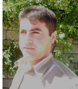
به ختیار سه باح

دهدریته پال ئه و کچانه یی، که ته مه نیان بگاته سهرووی (30 سال)، ئه مهش له ئه نجامی ئه وه وه بووه، که ره گه زی می خاوه ن بریارو قسه ی خوی نه بووه، چاوه پری بریاره کانی پیاو بووه، پیاویش هیچ کاتی که له بهر ژه وه ندی ئه و قسه ی نه کردووه، کچ بوی نه بووه به ناره زوی دلی خوی هاوسه ری ژانی هه لبریزی و بریاری هاوسه رگیری بدات. وابووه یان له سه ر بی شکه له خزمی کی نزدیکی باوکی ماره بر کراره، یاخود بۆ براو باوکی ژن به ژنی پیکراوه، بۆ باوک و برا گرنه گ نه بووه، که کچه که یان ده که ویتته چ ژیانیک و دۆزه خیک، ته نها خویان به مران بگن، ئیدی باکیان به کچ و خوشکه کانیان نه بووه، بویه شه زۆربه ی ئه و پرۆسه ی هاوسه رگیریانه سه رکه وتوو نه بوونه.