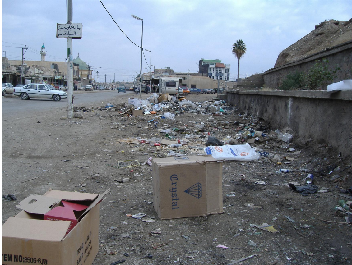
کونه باخچه ی قهلا (جاران شوینی خویندنی قوتابیان و حه سانه وهی کریکاران بوو ، نیستاش زبلدانه )