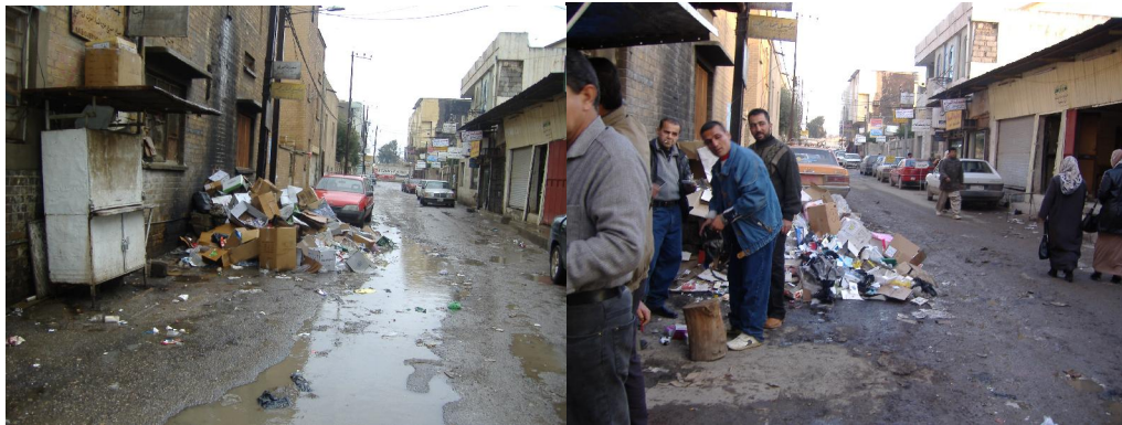
بەردەم ناسراوترىن پزىشكى شار

جەماوهرى كەركوك با لە داھاتوودا چاوەپوانى نەخۆشى شىتتى مانگاش بن ! ، لە كەركوك نەك تەنھا مرۆفە ئازادە ، ئەوپەرى ديموكراسى بۆ مانگاش ھەيە .