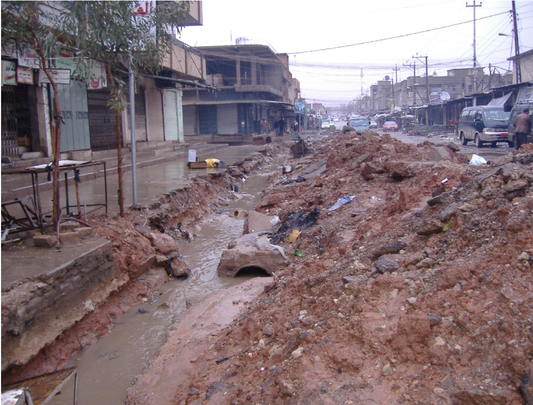
ئەمانەى خوارەوەش چەند وینەیه که له ئاستى خزمەتگوزارى له بازارى گەرەى پەحیماوہ , که سەنتەرى ناوچەى شارە .