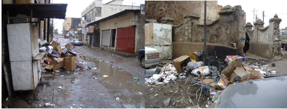
شەقامى پزىشكەكانى شار

كەركوكىيەكان بۆيە لە ئەنفلۆنزى بالىدە ناترسن ، چونكە كەرتى پزىشكى بەھىزو كارايان ھەيە ، نەك فايرۆسى پاسارى بگرە فايرۆسى ئەژدېھاش خۆى لەبەردەمىيان ناگرىت .