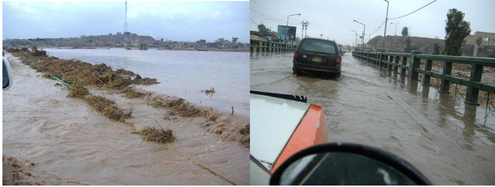
ئەم پردهش پزگاری بوو له بۆیە ی سهوز و زەرد