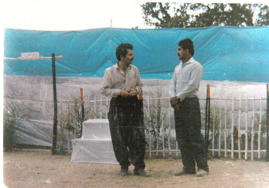
عبدولرّه زاق ئیسماعیل و عبدولّا گۆل

به وه ی کاتی رۆژی یه که می شانۆیی یه که مان پێشکه ش به خه لکه که کرد ، به کرده وه بۆیان ده رکه وت که هه رچی ئه و به ناو ( پێشنۆیژه ) داویه تی یه پالمان هه مووی درۆیه و دووره له راستی یه وه . به پێچه وانه ی مه به ستی گلاوی ، به جۆریک ده ستخۆشی مان لیکرا که مایه ی بیرچوونه وه نی یه . سه رجه میش برپاریان دا ئه و ( فایرۆسه ) له گونده که یان ده رکه ن ، هه روشیان کرد به جۆریک ده رکرا که هه تاماوه پووی ئه وه ی نه بیته به وناوچه یه دا بیته وه . ئه م کاره ی ئه وان هینده ی تر دلای ئیمه ی خۆش کرد و هه رچی ماندویتیتمان هه بوو تا ئه وکاته له له شمان ده رچوو ، که مه به ستی ئیمه شیان بۆ ئاشکراوو که له خزمه ت به وان هیچی دیکه مان مه به ست نی یه ، بۆیه داوای به رهه می دیکه یان لیده کردین .