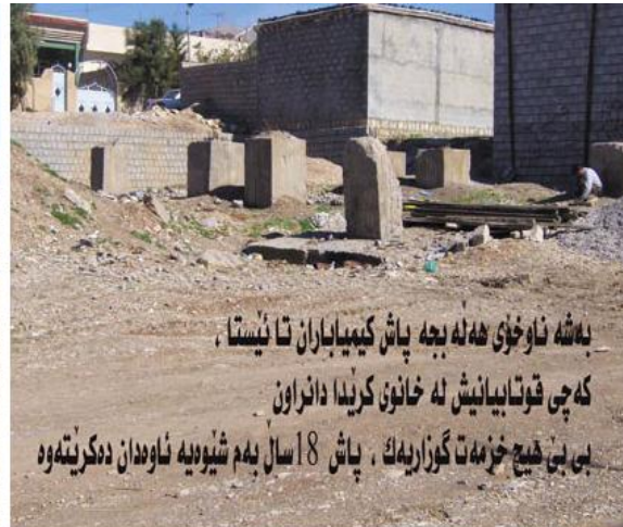
به شه ناو خوي شه نه بجه پاش کيميا باران تا نيستا ، که چي قوتاييانش نه خانوي کريدا دانراون بي بي هيچ خر مه ت گوزاريه ک ، پاش 18 سال بهم شيوه نه ناوه دان ده کريته وه