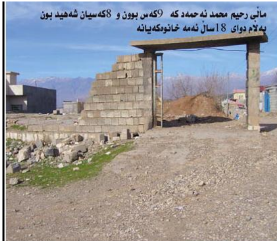
مالي رحيم محمد نه حمه د که 9 که س بوون و 8 که سيان شه هيد بون به لام دواي 18 سال نه مه خانوکه يانه