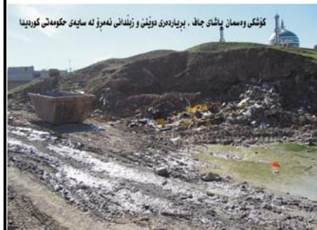
کوشکي و سه مان پاشاي جاف ، بر يار دوي دوتين و زبلداس نه مرؤ نه سايهي حکومتي کورديدا