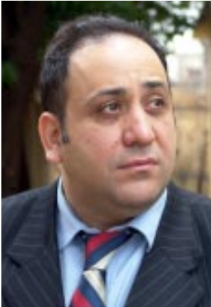
خەسەر و پیرایە

هەبیت، ئەو هەموو خەڵکی ناونوسکراوانە مووچەخوور و کارمەند و پۆلیس بە بێ ئەوەی کار بکەن و بەرەمیان هەبیت، دەبیت ئەمری دامەزرانیان پووچەڵ بکەیتەوه و ئەو بارە قوورسە لەسەر شانی بوودجەیی حکومەتی کوردستان کەم بکەیتەوه.