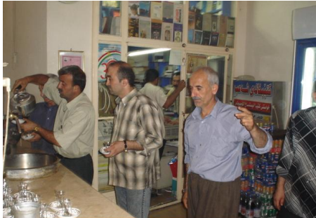
سەلمەمانى چاخەلى شەعب 050805 لەجەبەوہ: ھووا، عومەرى چاخى

لەتەنیشت کەسبکەوہ دانیشتم ئەو منى دەناسى وتەم: کتێ؟ نەحمەدى زاواى خالە عومەرم دەرچوو. لەسویدەوہ ھاتووتەرە بەمەبەستى دامەزراندن و گەرانەوہى بەکجاری. پاش ماوہبەک ھەلسام برۆم، کابرای سکرەتیر نەپەشت برۆم. ھاوکات بەکدووبەک لەژوورەوہ ھاتنەدەرەوہ، کابرای سکرەتیر لەگەل بېاویکى بەتەسەندا کردمبەه ژوورەوہ.