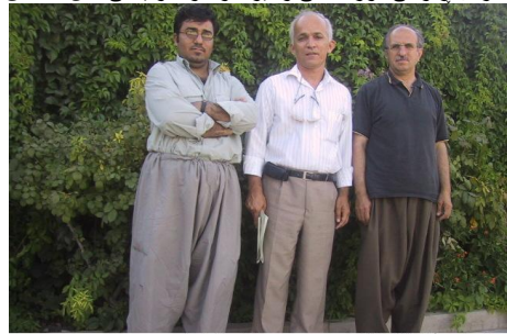
سەلمەنارى زرگور 1050731، راسنەوه: برايم عەلەرادەع، سوان.

لەبارەى رهوشى كوردستانى و نيرانهه بۆ ماوهىكى باش قسهمان كرد، لەسەر پەيوەندىيان لەگەڵ نەسەرىكا و ئۆپوزىسيۆنى نيرانى، هاوكارى نوان هيزمەكانى كوردستان نەو نارهزايەتپەنەى نەو كات لەشارمەكانى كوردستان لەجەرياندا بوو. موفاجمەنەى هەنەبۆاردننەوهى رەفسنجانى.