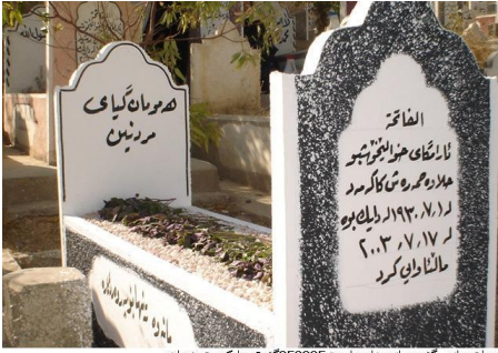
سەلمەنای گۆرستانێ ناوێرناست 050805 گۆرێ دایکی ع. شوان

کارمیش لعموه هات؛ گمر کەسیکی بیگانه سەردانی گۆرستانەکانی کوردستان بکات، بەهۆی ئەم نووسینانەوهی لەسەر گۆرەکان نووسراوه، وا دەزانیت لەواتیکی عەرمی دایه! هەست بەجیاوازییەکەمی ئەوتۆ ناکات! بەرینووسی عەرمی هەر چوار لای گۆرەکان بەناوەی قورانی نووسراوه! وێرای بۆیەکردنەوهی، دێرە عەرمی بێهەنگم پێکردن بەکوردی.