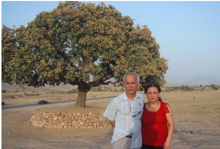
سه‌له‌مه‌نی داره‌ زه‌رده‌که‌ی قه‌ره‌داخ نێکه‌ گوندی جافه‌ران 050730 ده‌سه‌ره‌وه‌: ع. س. س. س.

به‌خاچه‌یه‌ی قه‌ره‌داخ و گوندی جافه‌ران تێپه‌رین له‌لای داره‌ زه‌رده‌که‌وه هه‌لوێسته‌یه‌که‌مان کرد، وینه‌مان له‌به‌ریدا گرت،