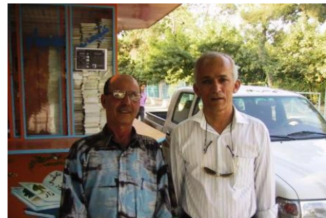
سەلمەمانى-سەلم/رەوہ کەسەخەى ئەوہ برۆژ050720 جەبەوہ: لەتيف ھەلمەتى، شاعەر، ج. شوان

لەسەر رەوشى کەرکوک پرسیارم لیکرد زۆر رەشېننەوہ وەلأمى داہەوہ. ھەرچەندە وەلأم داہەوہ کە بەو شېوہبە نېبە. لەلتى خۆمدا وتەم: تۆ سەیرى ئەم جۆرە کەسانە بکە چەند دلرەشن لەبەر امبەر بەکتر