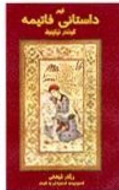
Sågar en Fatimeb i kurdiska verser...