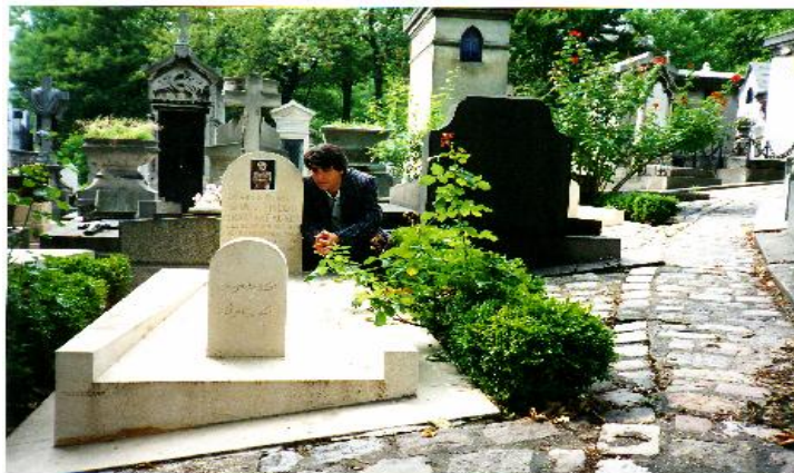
Gilkoy Sahid Dr.Abdulrahman Qasimlu 1996/8-19 Paris

دوو کچی هه‌یه مینا [1953 له پراگ له‌دایک بووه] و هیوا [1955 له تاران له‌دایک بووه]. پاش شه‌هید بوونی دوکتۆر قاسملۆ حیزبی دیموکراتی کوردستانی ئێران سادق شه‌ره‌هکه‌ندی {1938/1/1 - 1992/9/17} به سکرته‌یری حیزب دانا.