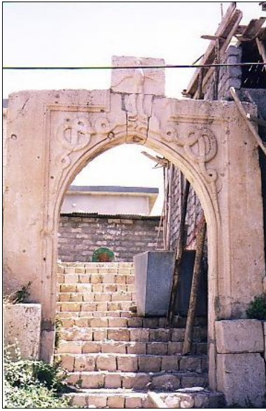
ئامىدى، دەرگای كۆنى بەھدینان بە كامىراى ھەندریین حوزەبیرانى 2005