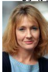
Joanne K. Rowling جوانە رۆلینگ كىيە؟!

بەسەرىدا زالېن، لەدەرەوھش بەھەمان شېوھ، دەوروبەرەكەى كۆمەلېك كەسانى دېندەو خراپ دەيانەوېت ئەم كورە بچەوسېننەوھو بەسەرىدا زالېن. ئەم كورەش زۆر ئازا دەبېت بەرەنگارى دوژمنەكانى دەبېتەوھ. بۆبەرگىكردن لەخۆشيو زالېوونە بەسەر كەسانى لەخۆى بەھىزتر، پەنادەباتە بەر ھونەرى سىجر. بەسىجر بەرەنگارى دوژمنەكانى دەبېت. ديارە ھەموو رووداوھكان، بەشيوھ يەكى قەنتازى (خەيالى) جوان و مەزن دارېژراون. ديارە ئەو سىجرە گەمانەى ئەم كورە (ھارى پۆتەر) دەيكات، بەشيوھ يەكى زۆر سەير ئەنجامى دەدات و خويئەر بەتايبەت (منداڭ و لاو) ھەست بەچېزىكى خۆش دەكات.