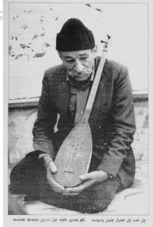
چە خەم چە خەم چە خەم و سۆسە نەو ھەموو خەمە جۆر ھەرچە ھەتە

پێناسەیهکی بەرفراوانی كوردە عەلهووییهكانی كوردستان بكەین و بەنەوهكانی ئەمڕۆ داھاتوویان بناسین لەگەڵ دیاریکردنی پەيوەندی ئەم گروۆ كوردانە بەنەتەوودە ئایینەو. ھەر وھا خستە رووی ھۆكاری دروست بوونی ئەم تاییانە بەناوی ھەمەجۆر كە لەمیژوودا رەنگیان داوتەو، دیسان ھۆكارە راستییەكانی بەشداریکردنیان لەو شۆرشانە (یاخیبووان-خەوارج) كە لەكوردستاندا بەرپادەبوون، سوود وەرگرتیان لەو شۆرشانەو ھەنگرتنی دروشمی تاییەت بۆ بەردەوام بوون لەسەر راپەرین و جوداخواری ئایینی و كۆمەلایەتی و سیاسی. ھەروا سەرژمیریان بەپێی ھەندیک سەرچاوە، زمان و شیوەزاری ئەو گروۆپە ئایینیانە كورد بەتاییەتی تاییە شەبەك و پەيوەندی بەنەتەوودەكەپەو.