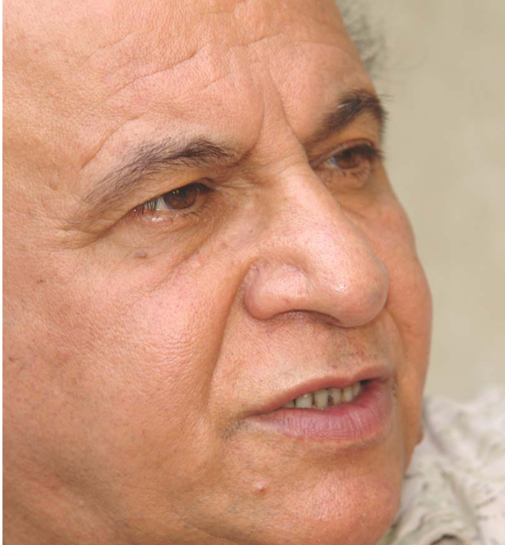
ھۆتۆ : ياسين عومەر

خەون، ئەو وئەدەيە يەكەم شتە لە ژياندا كە لەو كاتەوه ماوەتەوه، ئەو وئەدەيەم لەگەڵ پورتيك و خوشكەكمدا بوو كە گيرابوو لەبەر ئەوەی باوكم پۆليسی سواری بوو ئيمە وەك قەرەج ھەر رۆژە لە شوپتنيك بووين، ئەوہ يەكەم شتە كە بېرم بکەوتتەوه لە سەردەمی مناليم لەو ماوەيەدا، وە يەك دوو شەري بچكۆلەم بېرە لەگەڵ كچ و كورە گەرەك، بېرم دى چەند جارتيك سەرم شكاو، ديارە بەمنالى من تاراددەي دەرد و بەلا ترسنۆك و شەرم بووم وەك ھەمو جارتيك دووبارەي دەكەمەوه، يەك شتيش كە بېرم بيتتەوه لەو رۆژگارە ئەوہبوو، من منالى نۆبەرە بووم و ئەوہش بۆ خۆي كيشە بوو، ھەست دەكەم لەو رۆژگارەدا بۆني برسيتيم كردووہ و بۆني نەبوونيش، چونكە ھەميشە وەك لە گولتي رەشدا باسي دەكەم ھەرچيەكم دەويست پييان دەوتم نيبە، يەعنى من زۆر زوو بە نيبە ئاشنا بووم.