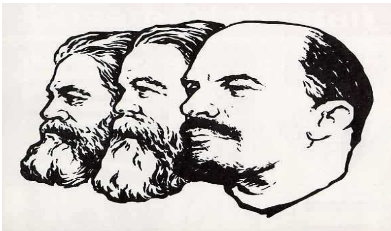
لینین در یژه پیدهری ریگه ی مارکس و نه نگسه