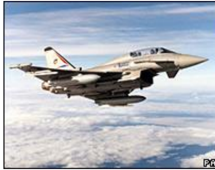
فروکه ی تایفۆن

خزمه تگوزاری تهن دروستی وکومه لایه تی هه یه، ئەمەش وایکردووە ملیۆنەها میسری ولاتەکه جیبهیلێت. کهچی حکومه ته دیکتاتورەکهی حوسنی موباره کیش، ئابەم شیوهیه پاره ی هه ژارانی میسر به فیروودەدات. دیاره ئەم راپورته تهنها باسی سالانی 1998 بۆ 2005 ی کردووە. گەرچی سالی 2006 یش له سالانی تر به به ره که تریوو بۆ کۆمپانیاکانی چهکی رۆژئاوا. بۆنموونه له سالی 2006 دا ، حکومه تی سعودیه بری 70 بلیۆن دۆلار فروکه ی جهنگی (تایفۆن) له به ریتانیا کری **. که ئەمه گه وره ترین سه فقه ی چهک کرینه له میژوی به ریتانیا دا. هه رچه نده سعودیه نکولی له بری ئەو پاره یه ی کرد ، به لام هه ندیک له میدیاکانی جیهان ده لێن ، خۆی ده داته نزیه کی 80 بلیۆن دۆلار. جیگای ئاماژه یه ، ئەم فروکه یه چه ند ولاتیکی ئەوروپی پیکه وه دروستی ده که ن . (ئەلمانیا ، ئیسپانیا ، ئیتالیا).