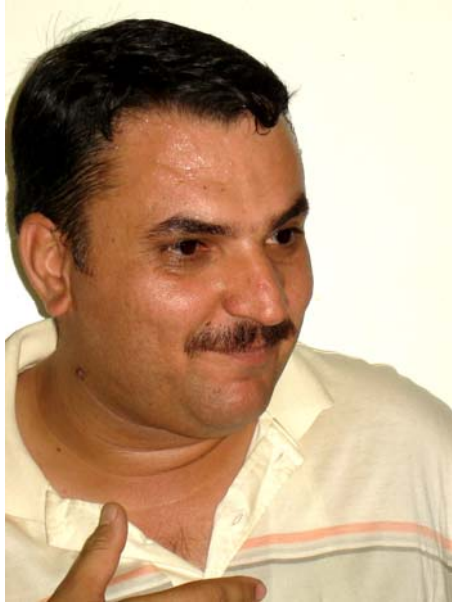
رىئىوار ھەمە توفىق