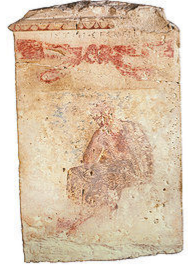
كۆتەلەتابلۇيەكى رەنگاورەنگى پياويكى رۇشنىر