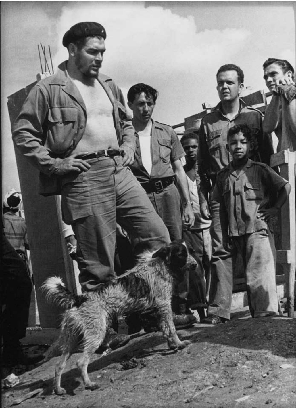
ئەم وێنە یە گەرە شۆرشگێری ئینتەرناسیۆنال چۆن گێقارای، چۆن گێقارای شۆرشگێر دکتۆر بوو بەلام نەبەدەویست کاری دکتۆری بکات چونکە دەبوت "نامەوت دەولەمەند بۆم، کاری دکتۆریش دەولەمەند دەکات" ئەم وێنە یە کە دواى شۆرشى کوبا گېراوه، چۆن گێقارای مەزن لەگەڵ پۆلێک خەلکی کوبا دەردەکەوت کە پێشنیاری بۆ کردوون لە رۆژی شەممەدا خۆبەخشانه کاربکەن بۆ بنیاتنانەوهی زیاتری ژێرخانی ئابوری وولاتیان، دەردەکەوت چەندە خاکیانە لەگەڵ خەلکە کە نیش دەکات، هەر بۆیە شە ناوی چۆن گێقارا وەک پێرۆزیەکی لێهاتوو لە هەموو ئەمریکای لاتین و جیھانیش، هەر ئەو خاکی و دلسۆزی و راستگویی گێقارایە وای کردوو منالانی کوبا لە قوتابخانەکانیان هەموو رۆژیک ئەو ووتە یە بڵێنەوه "هەموومان دەبین بە گێقارا" ئێمە ی کوردیش لە هەر رۆژیک زیاتر ئەمۆ پێویستیمان بەو جۆرە سەرکردانە یە، بەلام ئایا ئەو سەرکردانە بوونیان هەیە؟؟