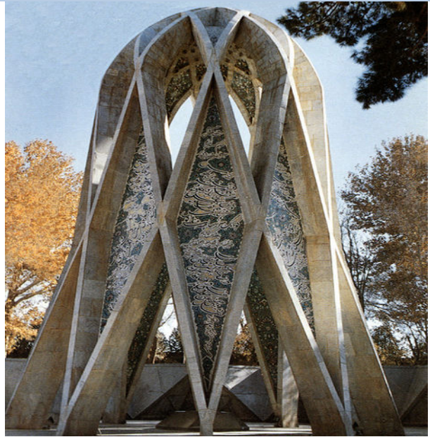
مۆنومېنتى خەييىام، نىشانىپوور، ئىران