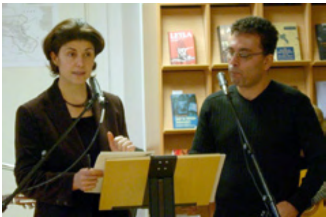
دلاوهر قەرەداغى و نەزەند بەگىفانى و ھەرگىز دراوھ. بىرپارە ئەم نەمىشە بەرھو شارى لەندەنیش بگۆزىرتەوھە.

لە دەرھىنانى دەرھىنەرى مەكسىكى (بىپى گودىنۆ) و ھەرگىزى بايز شوکور و بىرتراند فولى و سەرپەرشتى ھونەرماند خاتوو (ئىدیت ھىنىرى) سەعات ۸ ئىوارەرۆزى ھەينى ۲۰۰۷/۱۱/۳۰ قەسیدەى زەنگى خۇل بە زمانى قەرەنسىي و لە شارى (ليل) بۇ ماوھى سىرۆز نەمىش دەكرىت. قەسیدەپرەنگى خۇل