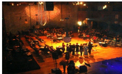
چەند ديمەنىك لە قىستيفالەكە