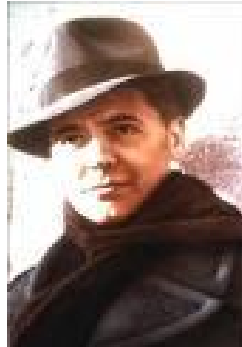
Jean Moulin، هیمای بزاڤی بەرهنگاری فەرەنسی بە ملپێجەکەیهوه

فیلمە ئەفسانەییەکەى Orson Welles / ئورسۆن ویلس "Citizen Kane/ کانیی هاوولاتی" بە دیمەنى یادهوهرییهکی گرانبهها دەستپێدهکا، لهویدا چارلس فوستەر کانیی پیر له سههره مهرگدا لهو کاتهى به دهنگیكى كزهوه دوا وشهى خۆى –Rosenbud گۆ دهكا كه لایهكى شووشهیی لهگهڵ دیمه نیکی زستانی به یهكێك له دهستهکانییهوه گرتوه. (کانی) یهكێك بوو له پیاوه ههر بههیزهکانی رۆژگاری خۆى، پیاویکی سهرنجکێش خاوهن ئاوهزی خۆى بوو كه خولیایهکی سیاسیی گهرههه بوو – لای خهلك خۆشهویست، رقیلهههگیراو، مایهى گفتوگۆ بوو. دواى مردنى رۆژنامه نووسیک ههولدهدا لهسههر به دۆزینهوهى سههره داویک بۆ سۆراخکردنى وشه ماندارهکەى "Rosenbud" ئەو وهک مرۆفیک راستییهک دهسته بهر بکا.