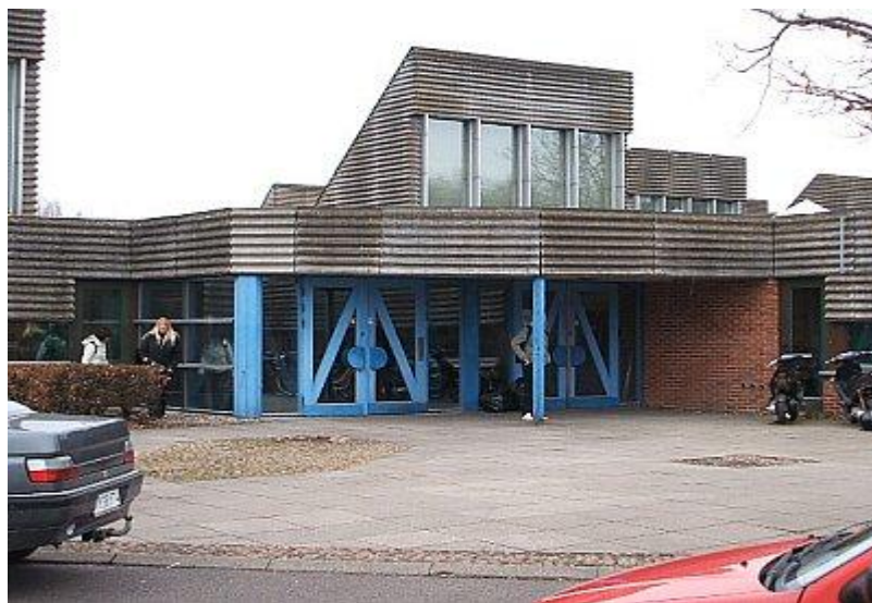
هیمهلیو گیمنازیۆم له باژێری رۆسکیله

ههر له روانگهی بو زیاتر ناساندنی کارهساتی ههلهبجه و ئهنفال له رۆژی یادی کارهساتی ههلهبجه، داسهرلهبهیانیهکهی ههندی له ئهندامنی ناوهندی چاک سهردانی ئامادهیی هیمهلیو له شاری رۆسکیلهدا Himmelev Gymnasium- HF / Roskilde کرد، ئهندامنی چاک له میانهی وۆرک شوپیکی پرسیار و وهلامدا دهستیان به گفتوگۆ و زانیاری گۆرینهوه به زمانی دانیمارکی لهگهڵ خویندکارانی خویندگهکهدا دهستپیکرد. شایانی گوتنه خویندکاران زۆر بهگهرمی پیشوازیان ههبوو و پرسیاریان لهسهر کارهسات و ترازیدیایکانی ههلهبجه و ئهنفال له ئهندامنی چاک دهکرد و گفتوگۆیان لهسهر دهکردن. خویندکاران لهگهڵ ئهندامنی چاک دا بهدلخۆشیهوه دهستیان به بلاکردنهوهی بهیان و نووسراوهکانی ناوهندی چاک له خویندگهکهدا کرد.