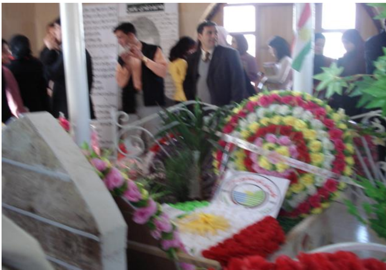
ئارامگەى تازه نوژەنكراوہى دلداری شاعیر، 20-2-2007 كۆپە