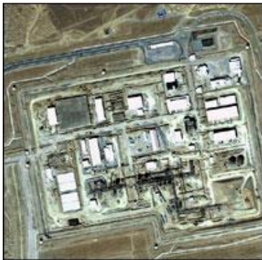
ۋىنەى 2002 ى ئاراك

ئاۋى قورسىش بۇ دوۋجۇر ئامانچ ۋمەبەست بەكاردەھىنرىن