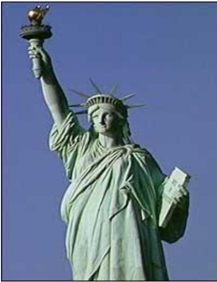
مەشخەل وەك سەمبولىك بۇ ئازادى بەدىدى بارتھۆلدى