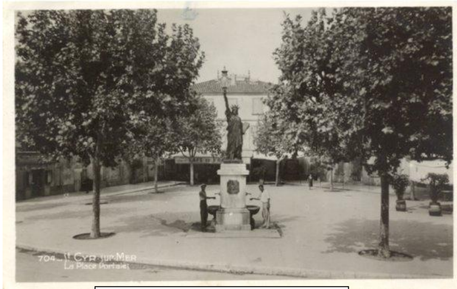
وینەى يەكەمى پەيكەرەكە ئەسەرتەى دروستكردنىدا

پەيكەرى ئازادى بەرزىيەكەى 46 مەتر و پەردەى بۇ يەكە مچار بەشپوھىيەكى فەرمى ئەرىكەوتى 28 ى ئۆكتۇبەرى ( مانگى 10 ) سائى 1884 ئەسەر لادرا ، دواى ئەوھى لەوھرشەى كار لە پارىس تەواو بوو ، ھەرلەوكاتە سەرۆكى ئەمەرىكاي ئەو سەردەمە (( جروفەر كليفيلاندا )) بېرىارى دا وەك نوینەرى گەلى ئەمەرىكا ئەم ديارىيە لەوولاتى فەرەنسا قەبول بکات ئەمەش وەك دەرىپىنىك بۇ ئەو ھاوايىيەتییەى كەلەنپوان ھەردووگەلى فەرەنسا و ئەمەرىكادا ھەيە ، ئەوھى مایەى سەرنج راکیشانە ئەوھىيە كەدەبوایە (( گرىمانەى ئەوھە بوو )) لەدەروازەى كەنالى سويسى ميسرى بىت نەك لەدەروازەى شارى نيويۆرك ئەنەمەرىكا ، ئەمەش كاتىك ئەو گرىمانەيە ھاتە ئاراوہ كە پەيكەرتاش بارتھۆلدى كەخۆى ئەدايك بووى ھەرىمى (( ئەلزاس )) ە كەدەكەویتیە باكورى رۆژئاواى فەرەنساى سائى 1834 سەردانى ميسرى كرد لەسائى 1856 و زۆر سەرى سورما بەكارەمەزنەكانى پيشينيانى ميسر )) فیرعەونەكان )) ھەر ئەوكارانەوہ بېرۆكەى ئەو پەيكەرى ئافرەتەى كەمەشخەلى ئاگرى بەدەستەوہبىت وەرگرت تا ببیتە منارەى كەنالى سويس كەئەوكاتە كارى ھەلكەندنى كەندالەكەى تيا دەكرا و بېرىارش بوو ئەو پەيكەرە لەسائى 1869 پەردەى ئەسەر لادىریت لەدەروازەى كەنالى سويس ، بۇ جارى دووم بارتھۆلدى سەردانى ميسرى كەدەوہ لەسائى 1869 و بېرۆكەكەى خۆى پيشكەش بەخدیوى ئىسماعیل دەسەلاتدارى ميسر ئەوسەردەمەدا كرد ، ئەمەش ئەشپوھى پەيكەرىكى بچوكراوہ وەك ھەنگاوى پرۆژەيەك بەناوى ((ميسر منارەى رۆژھەلاتە )) تاكو لەدەروازەى باشوورى كەنالى سويس دانرى ، لەگەل ئەوھى خدیوى ئىسماعیل ئەسەرەتاوہ زۆر ھاندەرى بېرۆكەكەش بوو وەك پرۆژەيەكى ھونەرى ، بەلام دواتر لەوھاندان و بېرۆكەيە