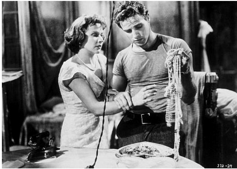
دیمەتیک لە شانۆی (پیشانگەى ئازەلە شووشەییەکان)

تواناکانى تینسى ویامز وەك شانۆنووس زیاتر لە شانۆی (پیشانگەى ئازەلە شووشەییەکان)دا دەرکەوت، کە جوانترین دیالۆگى لەخۆگرتبوو، کە هزرى هەر نووسەریکی درامایى ئەمریکى بگرت بە داهینانى دیمەنى سۆزداری و کارەکتەرەکانى کاریگەرن.