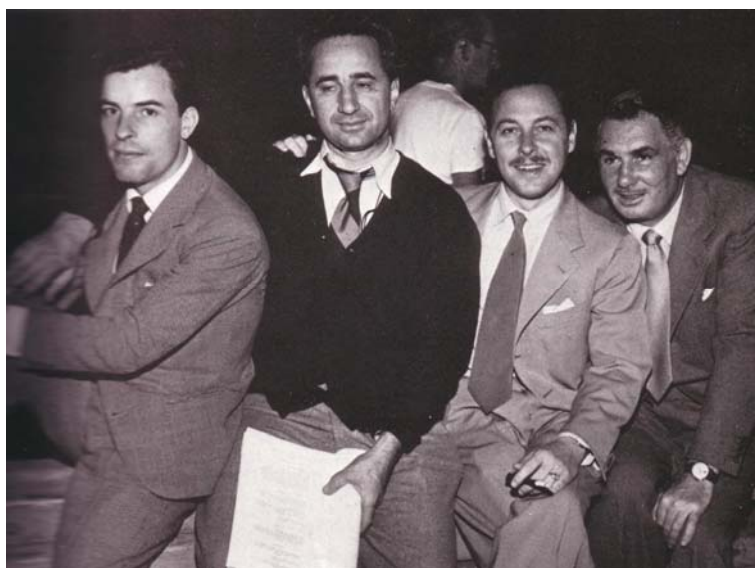
تینسی ویامز لہ گہل ستافی شانویہ کیدا

وہ لامی خوی ہیبت، بوئم مہبہستہش ئوہی بو دوپاتدہ کاتہوہ کہ ہہرگیز تہ ماشای نہ کردوہ، بہ لام (جوئن) ئہ ہریمہ نیی گچکہ وک ویامز وینای کردوہ راوکہ ریکی کارامہ یہ، چہندہا تہ لہ و کو سپ سہرہ پی (ئہلما) دا دادہ نیٹ و ئوہشی بو دوپاتدہ کاتہوہ، کہ لہ دوورہوہ چاودییری کردوہ.