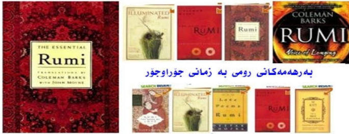
بەرھەمەکانی رومی بە زمانی جۆراوجۆر

دوایی کردوو. بە مندالی باریان کردوو بۆ شاری کونیا[قونیا]ی کوردستانی تورکیا و ھەر لەویش ئەو پاشناوەی رومی وەرگرتوو ، ئەوسەرەدەمە بەو ناوچەییە دەگوترێت خاکی روم . ھەنووکە مەزاری لەو شارەییە و خەلکی زیارەتی گۆری دەکەن .ژنەکی سەمەرەقەندی ھیناوە بەناوی [جەوھەرەخاتون] و کۆرەکی لی بوو و ناوی ناوہ سوڵتان .سویدیەکان لەسالانی سیبەکانەو بەھۆی نووسەری بەناوبانگ [ئێریک ھیرمەلین 1860 – 1944] ئاشنای بەرھەمەکانی مەولانا بوون .پاشان نووسەریکی گەنج [ئاشق دالین 1972/6/3] شاعرەکانی مەولای بەشێوەیەکی تازە وەرگێڕا بۆ زمانی سویدی . ئەو ئاشکە[عاشق] لە تاران لە دایک بوو و بە مندالی ھیناویانە بۆ سوید و خۆی خەریکی ئیرانیست و ئایین و وەرگێری ئەدەبی فارسی یە .مەولانا کاردانەوی بەسەر شاعیرانی سوید ھەبوو وەک نووسەرێک [فیلھلم ئیکەلوند 1880/10/14 – 1949/9/3] و [گونار ئیکەلوف 1907/9/15 – 1968/3/16] و [ئێریک فون پوست 1899/10/3 – 1990] و [فیلی شیرکلوند 1921/2/27] و [ئینگمار لیکوس 1928] و [کورت ئالمکفیست 1912 – 2001] . سالی 2007 ئینستیتیوتی مەولانا لە شاری ستۆکھۆلم دامەزرا بۆ ئەوێ زانیاری زیاتر دەربارەى جەلال ئەددین رومی بڵاوبکاتەو و زیاتر زانیاری وەدەست بەینی . گەلۆ ئەو نووسەر و شاعیرە مەزنە لە ئەدەبی کوردی دا گرنگی یەکی ئاوا شایەستەى پێدراو و بەرھەمەکانی کراوە بە کوردی .