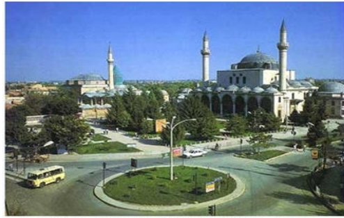
کۆرەپاتی مەولانا ئە شاری کونیا[قونیا] مەزارگای جەلالەددین رومی

شاعرەکانی لەبەرکراوە و دەیلێنەو. لە ھەموو جیھان دەرویتشی خۆی ھەبە و بە زمانی جۆراوجۆر شاعرەکانی و نووسینەکانی بڵاوەکراوەتەو و ھەتا ئەمڕۆکە دەرباری دەنوسریت .بۆ یادى لەدایک بوونی [یۆنیسکۆ] لە پاريس یادى ئەو مرقە بەرزەى کردەو .ناوی [مەھمەد کۆپى مەھمەد کۆپى حسین بەھائەددین]ە .لە ریکەوتى 1207/9/30 لەدایک بوو و لە 1273/12/17 کۆچى