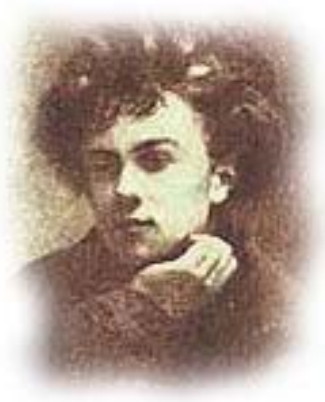
بروسكە يەك نە رامبۆۋە بۆ دايسى