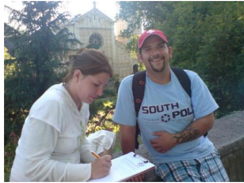
ولآته یه کگرتوه کانی نه مریکا