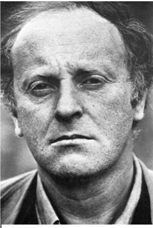
برؤدسكى: "بؤ نووسەر تەنيا يەك جؤر ولاتپارىزى ھەيە: ھە ئويستى ئەو بەرانبەر بە زمانە - - ئەدەبى خراپ جؤرىكە ئە خيانەت."