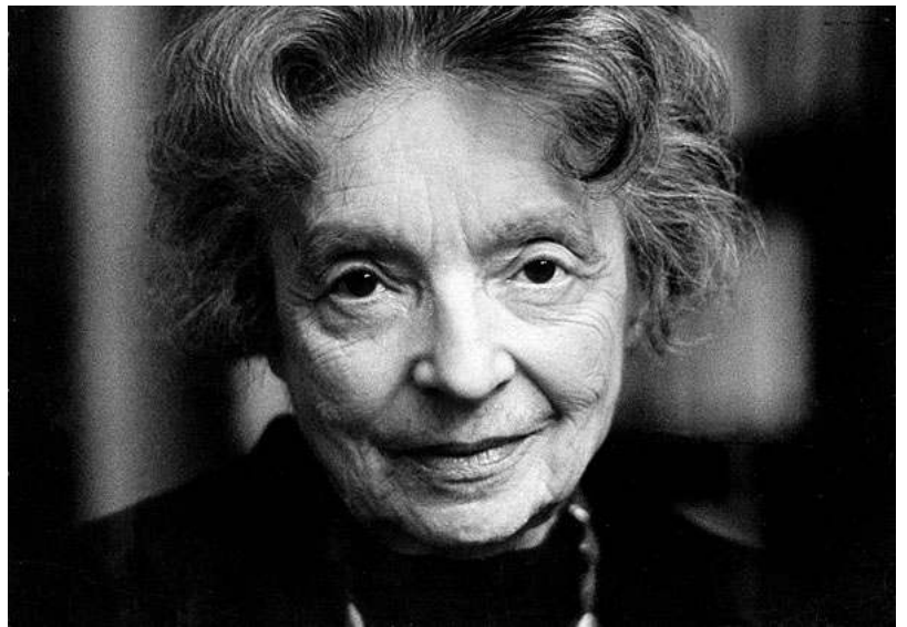
نىلى ساكس: "كەسى نامؤ، ھەمىشە نىشتىمانى وەك مندائىكى بىن دايك و باوك ئە باوھشيدا ھە ئدەگرى"