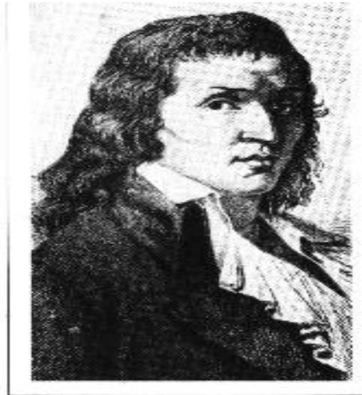
© G. Schaeff (nach einem Kupferstich von J. Scher.)

پېشەككىيەكى كورت: وەك ئاشكرايە،ماركس/ئەنگلس لە ئاشنابوونيان بە بزووتنەوہى سۇسىيالىستى و كۆمونىستى فەرەنسى، شان بەشانى ئابوورى بەرىتانىا و فەلسەفەى ئەلمانى، گەشەيان بە بىروپراكەيان دا. ھەردوکیان، لە ئیدۇلۇژى ئەلمانى، مانیفېستى حىزبى كۆمونىست، نامەكان و يەككىتى كۆمونىستەكانى ئەلمانىھىمايان بۇ ناوى بابىف كردووه. ئىمەيش، ھەر بە حوكمى بارودۇخەكەمان زانىارىمان زۇر كەمە لە بارەى قۇناغى بزووتنەوہى كۆمونىزم لە فەرەنسا، پېشى كۆمونىستى زانستى. لە پاش شۇشى گەلانى ئىران