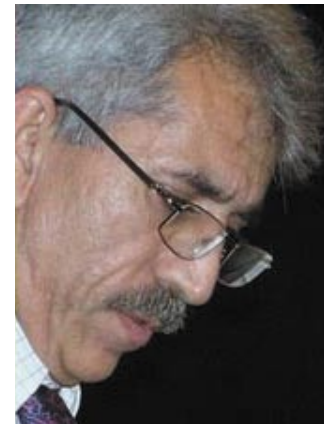
◆ ناسری جیسامی

دهمیکی دریز بوو وهستا بووم. سیبهری چیا که هاته خوار، سه راسه ر پیده شتی داپوشی. نه هاتی لهو ده شته خاموشه بتینیم. ههوریکی لوکه یی، هاته سه ر ئاسمانی چیا که و، سیبهری له سینه ی گهنمجار خشان دو، تیپه ری. نه هاتیبه بهر ریژ نه ی بارانی گرینیم.