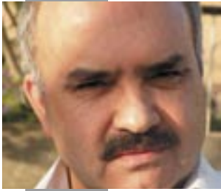
◆ م. ا. غول