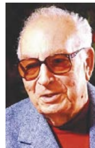
و: مستهفا زاھیدی

(یهشار کهمال) پیره پیاویکی ۸۵ ساله که له گهڵ بیهیزی جهسته بیدا راهاتوووه له ژوووه شپززه کهدا دانیشتوووه. نووسه ریک که به شیکی زۆر له خه لکی تورکیا لاینا بوو یه کهم کهس ده بیته که خه لاتتی نۆبل ده هیئتیه ماله وه. (عایشه بابان) چای ده هیئیت بۆ هاوسه ره کهی (یهشار کهمال) و ده لیت: (تائیتستا رۆژنامه نووسیکم نه دیوه پرسیری کهم بپرسیته. یهشار! بهیله با ئەم کوره قسه کانی بکات).