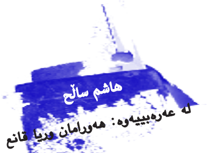
له عهرييهوه: هورمان دريا قانع