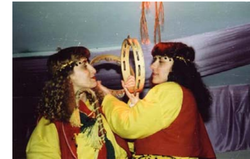
مه له فیک بو میدیا رهئوف

شانۆکارانی ههوتییر له بهردهم ناسته نگه کانی شانۆدا