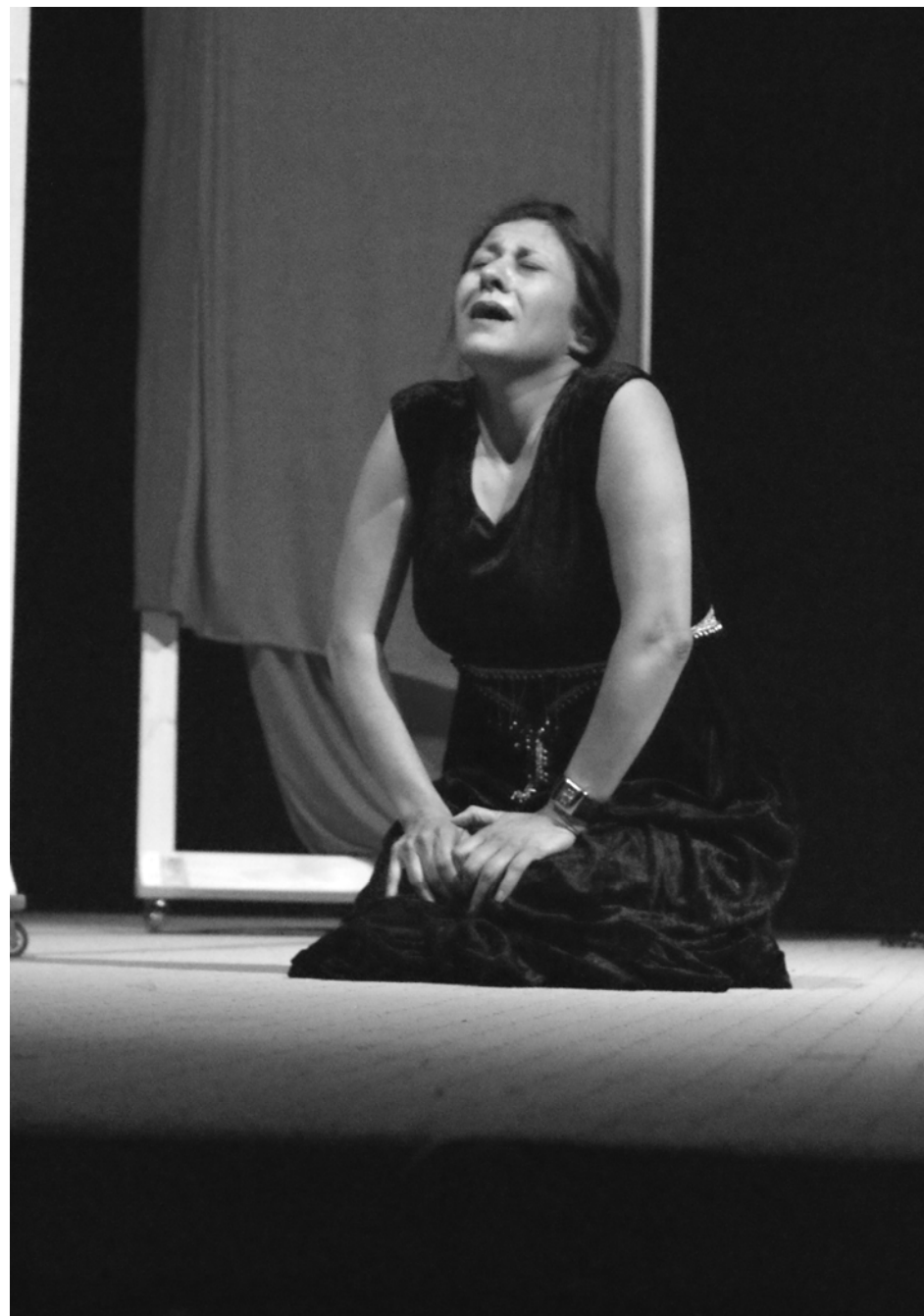
(میدیا) ده یویست کۆنسیپته کانی شانۆگه ریبه که بگه یه نیت. باسم له جووله، دهنگ، زمانی جهسته و ئاراسته کان ده کرد، که ده یانتوانی مه سیجه کان بگه یه ننه بینه ر. به مانه یکی تر چۆن (میدیا) ده یه ویت له ریگای فه لسه فه ی

جهسته وه ورده کارییه کانی ئه و چه مکانه مان پی بلیت، که تا ئه و ساته لامان شاراره بووه. جووله کانی به پیی حاله ته جیاوازه کانی سایکۆلۆجیا و تۆنی دهنگ ریك ده خست: بهرز، نزم، چیه و هاوار. له ناکاو نزم و دوایی بهرز. ئه گه رچی به ته نیا له سه ر شانۆ نمایشی ده کرد، به لام زۆر لیها توانه ده یتوانی کۆمه لیک که سی جیاوا زمان چ وه ک سیما و چ وه ک دهنگ بینیت به رچاو. ئه و ده یتوانی جاریک کچه که بیت، جاریک کوره که، جاریک منداله که، جاریک دایک، جاریک باوک و