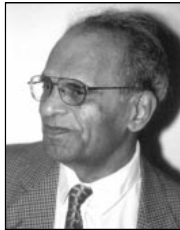
فازیل عه زواوی

تاکه که سیکه وه، کومه لگایه کمان پی دهناسینیت، نیمه له پتی برایانی کرمازوفه وه روسیامان ناسی. ئیسراییل هموو فهلهستین خاپوور بکا، نهو ولاته له رومانه کانی غهسان که نغانیدا ژبانی لی ده تکئی. رومان بهریهستیکه بوار نادات، داگیرکه ر میژووی گه لیکه بندهستی بسریته وه، موساد بایهخی رومانی ده زانی، بویه غهسان که نغانی تیرور کرد.